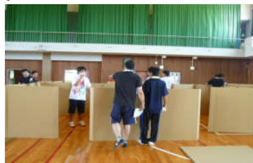
パーテーション作り