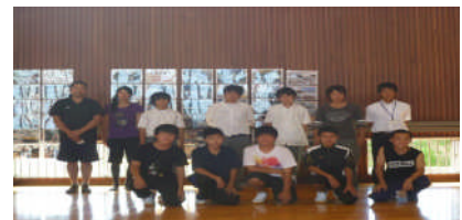
本校からの参加者