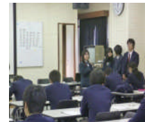
情報システム科の発表風景