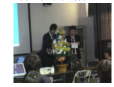
電気電子科の発表風景