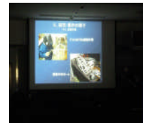
機械科の発表風景