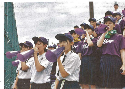
名物「田辺が大将」で懸命に応援するチアリーダー