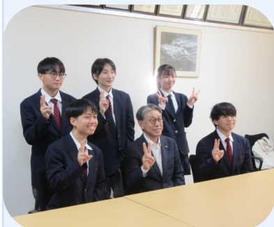
田辺市長さんと生徒会役員

10月26日（水）に田辺市長さんが来校され、生徒会役員の皆さんと懇談の時間をもたれました。気さくにお声をかけられた生徒の皆さんは誠意を込めて、本校の紹介を行いました。